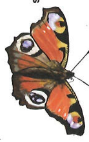
Paon de jour

L'itinéraire suit en partie les bornes point neuds.